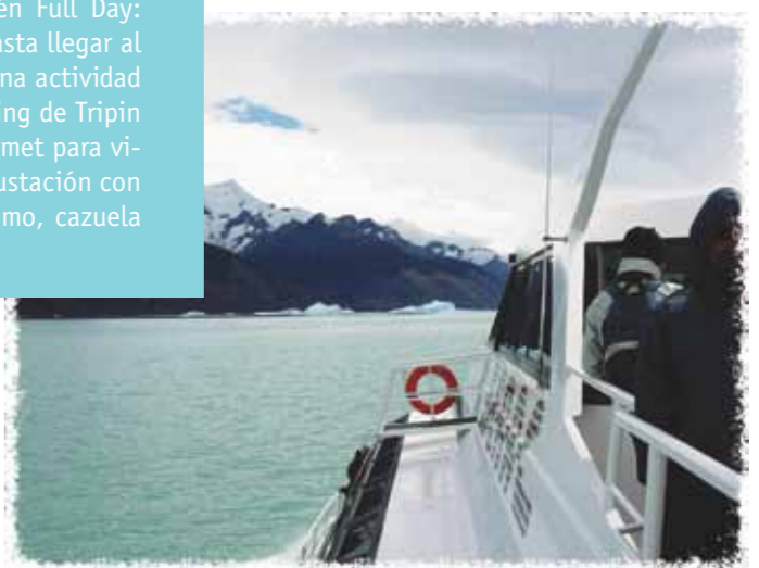
Izquierda: jornada de trekking Arriba: glaciar Perito Moreno Abajo izq.: glaciar Upsala Abajo der.: paseo y avistamiento en barco.

A tan solo un kilómetro del centro comercial, en una zona cercana al lago Argentino, se encuentra la reserva de avifauna Laguna Nimez, donde se destacan alrededor de 80 especies de aves. A solo dos horas de recorrido, se encuentra Punta Walichu. Este es un sitio arqueológico que presenta una conformación geológica muy original. Aquí, pueden apreciarse aleros y cuevas naturales que utilizó el hombre prehistórico para la ejecución de sus manifestaciones pictóricas. También El Calafate ofrece el museo del hielo patagónico, Glaciarium, dedicado al hielo y a los glaciares de la Patagonia. Este es un centro de interpretación dedicado por completo a entender estos complejos fenómenos naturales.