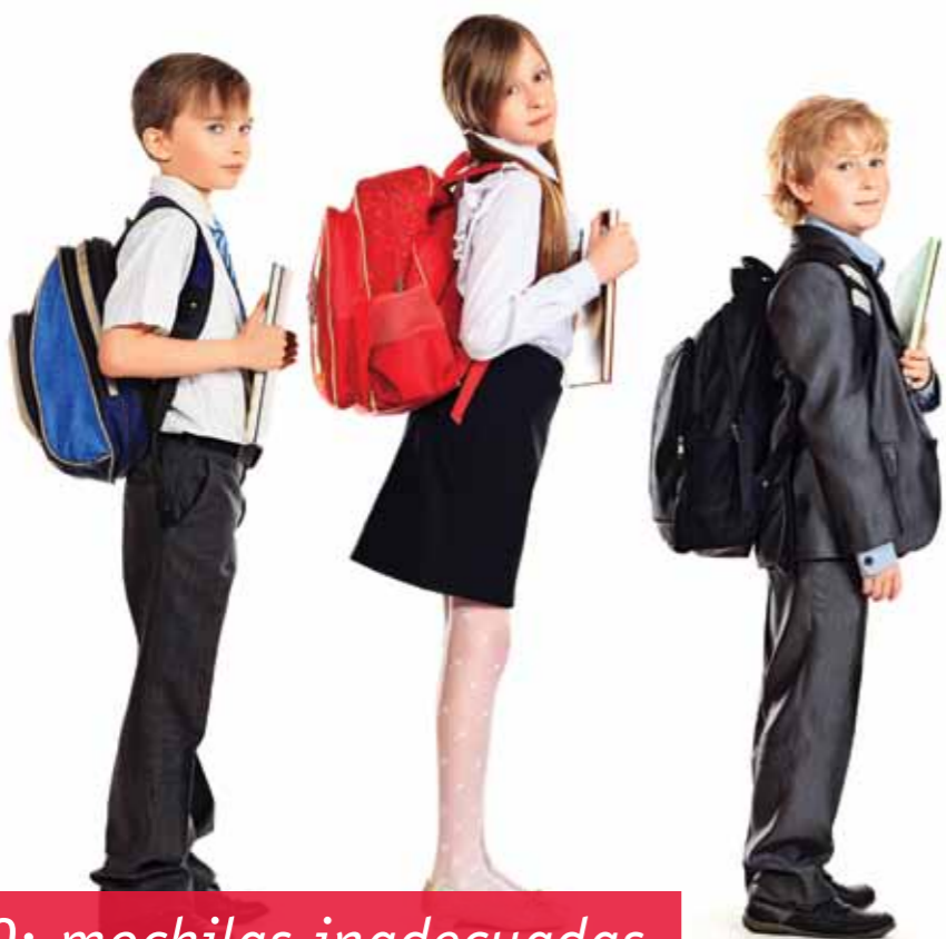
Por Agustín Biasotti