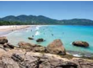
Arriba: Bahía do Sancho, Fernando de Noronha.

Fernando de Noronha es uno de los destinos que hay que conocer de Brasil; sus playas siempre están en los rankings de las revistas especializadas en turismo. De ellas, Bahía do Sancho es la número uno; allí no hay negocios, restaurantes ni distracciones. Para acceder hay que bajar escaleras enclavadas en la roca. Lo mejor es caminar hasta su cascada de agua dulce. El segundo puesto es para Bahía dos Porcos, que se destaca por sus piletas naturales, donde nadan peces multicolores, tortugas y rayas que los que hacen snorkel espían. Una hamaca, la brisa del mar y un cóctel de frutas naturales. ¿Se puede pedir algo más? •