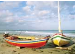
Medio: Lopes Mendes, Ilha Grande, Praia do Jericoacoara.