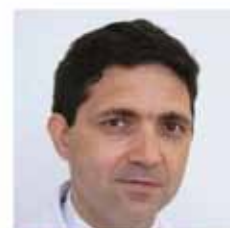
DR. A. DEVIGGIANO RM cardíaca. Coord. Imágenes Cardiovasculares.