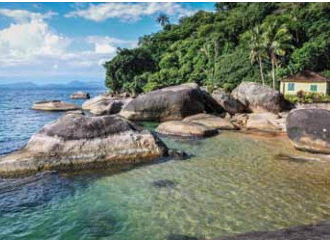
Abajo: Ilha Grande, Río de Janeiro.